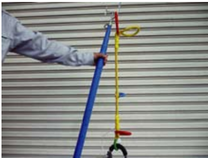
赤色のリングを操作棒に装着