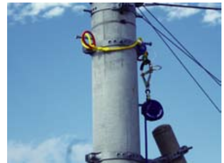
共架柱にロープを掛けた例