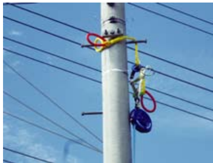
単独柱にロープを掛けた例