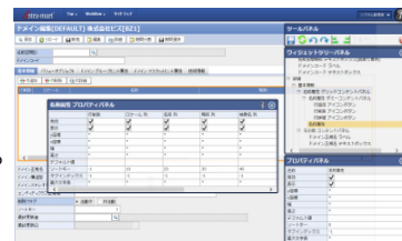
(画面レイアウトの編集機能)

仕様書と実際に仕上がってきたシステムとの「ギャップ」に悩んだことはありませんか？ 新開発基盤の採用により、設計段階から実際の画面を見ていただくことが可能になりました。 仕上がりを明確にイメージしながら要件を固めることで、改修コストも最小限に抑えます。