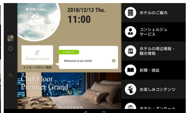
イータブ・プラス画面イメージ