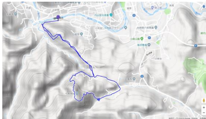
図 2 トレイルタイムレースコース