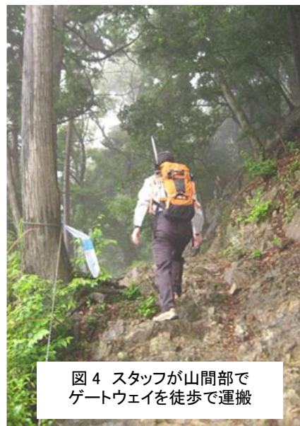
図 4 スタッフが山間部で ゲートウェイを徒歩で運搬