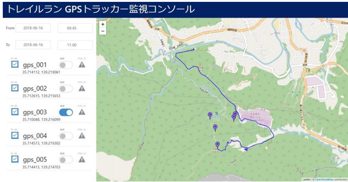
図 1 開発中のランナーtrackingシステム画面 ランナーおよびスタッフの位置情報を取得