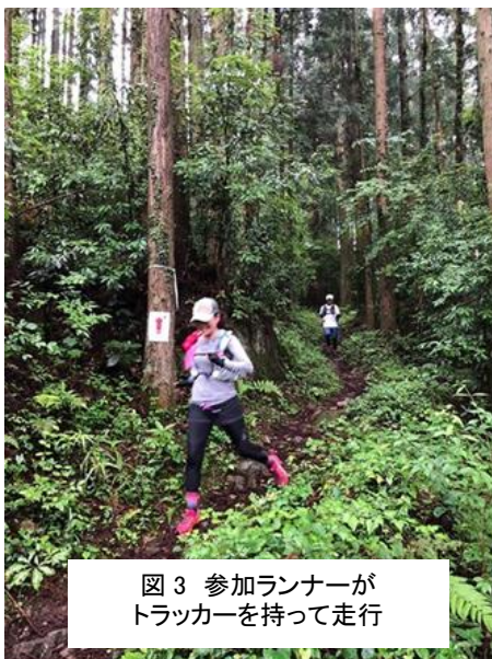
図 3 参加ランナーが トラッカーを持って走行