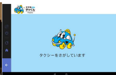
タクシー呼び出し画像イメージ