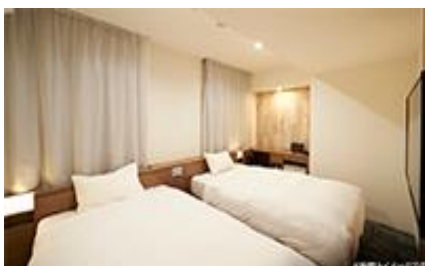
客室設置イメージ

その他にもイータブ・プラスの汎用性の高さを活かし、ホテルの提供する『洗濯機の利用状況』や『朝食会場の混雑状況』などホテルオリジナルの機能や多くのコンテンツの搭載を実現し、宿泊や旅全体の利便性向上を図ります。