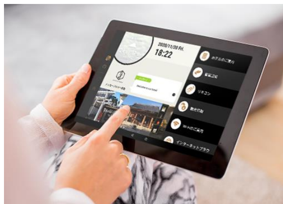
タブレットイメージ